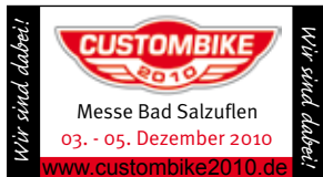
Messeaufkleber 38 x 21 mm

Ja, bitte schicken Sie uns Sticker zum Aufkleben auf unsere Geschäftspost.